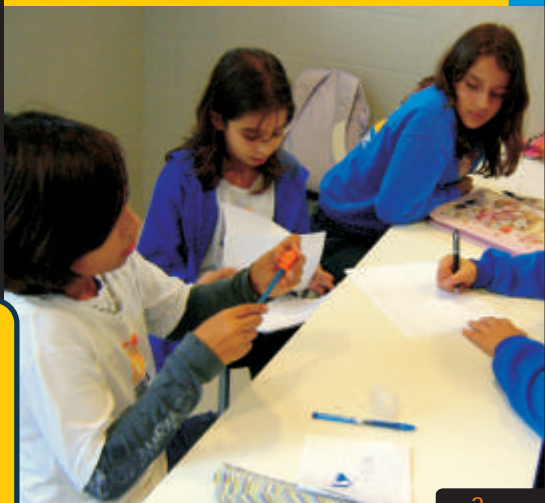
Alunos em atividade da Oficina de Pesquisa

Outros temas pesquisados e estudados foram o Bullying e a Política. O primeiro resultou em uma campanha contra a prática dessa violência "mascarada" nas escolas enquanto que o último foi bastante proveitoso tendo em vista o momento eleitoral vivido no país.