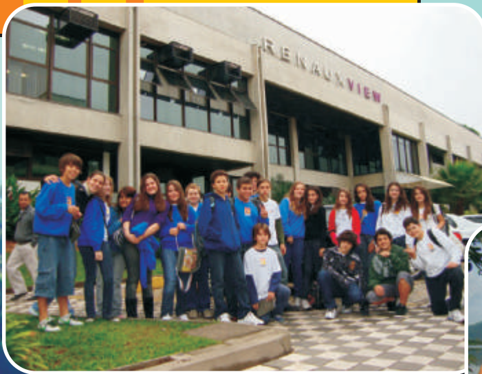
Renaux View Brusque/SC 8º e 9º Anos