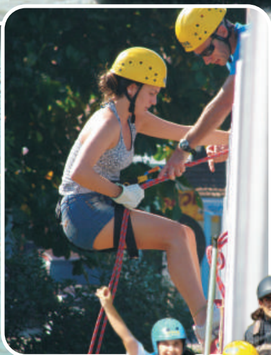
Rafting e Rapel Santo Amaro da Imperatriz/SC 6º, 7º, 8º e 9º Anos